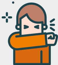
Hoest en nies in de binnenkant van je elleboog