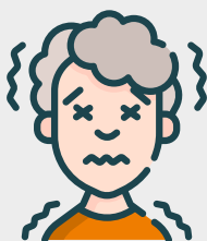
Blijf thuis bij klachten

Los van bovenstaande maatregelen gelden natuurlijk ook de richtlijnen vanuit het RIVM, namelijk: