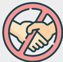
Schud geen handen