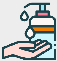
Was vaak je handen