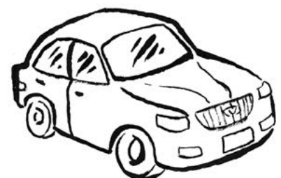
auto (kies zelf de kleur)