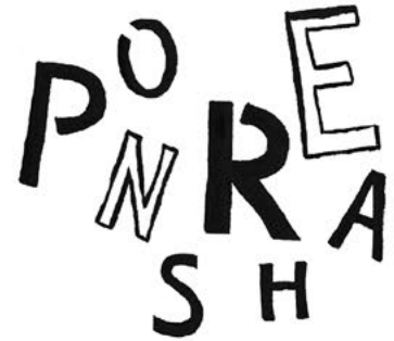
omcirkel een letter en zoek deze